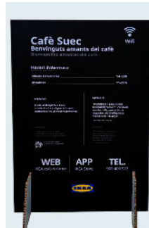
tótems con peana